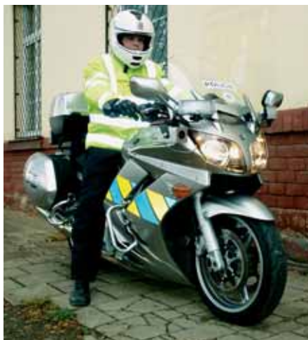
Policejní yamaha o obsahu 1300 ccm je v silničním provozu velmi účinným pomocníkem.

Na provoz na desítkách silnic všech tříd dohlíží osmapadesát policistů. Oddělení se dělí na tým, který zpracovává dopravní nehody, a tým policistů, kteří se věnují doзору nad silničním provozem. Speciální součástí dopravního inspektorátu je pak úsek dopravního inženýrství, jehož pracovníci se vyjadřují ke všem změnám v systému silničního provozu. Pokud například město, kraj či třeba jiný investor staví novou komunikaci nebo na těch stávajících chce udělat novou křižovatku či jiný prvek, konzultuje to právě s dopravními inženýry.