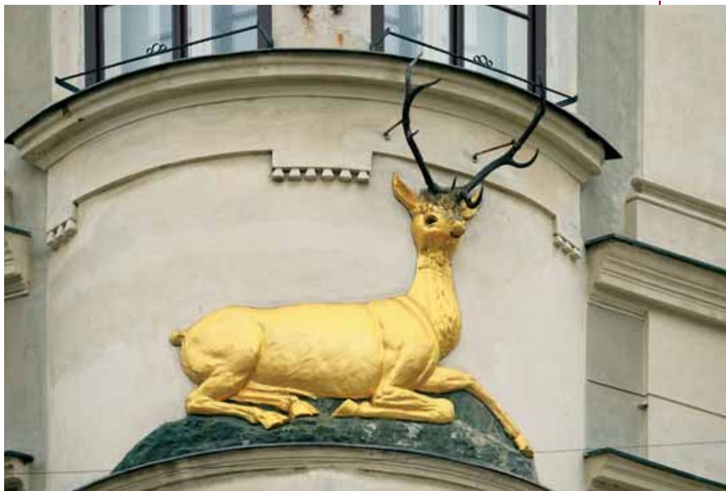
Nejslavnějším domovním znamením je v Olomouci zlatý jelen.

Od roku 2005 pak postupně na fasády domů na Horním a Dolním náměstí přibylo už sedm nových znamení, mimo jiné i bílá růže, zlatá koule, modrá hvězda či stříbrný rýč. V přípravě je osmé znamení, a to bílá labuť, která bude zdobit průčelí jednoho z domů na Dolním náměstí,